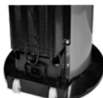
Roulettes de transport intégrées

The Carbon block filtration kit 100% hygienic 5000L water treatment